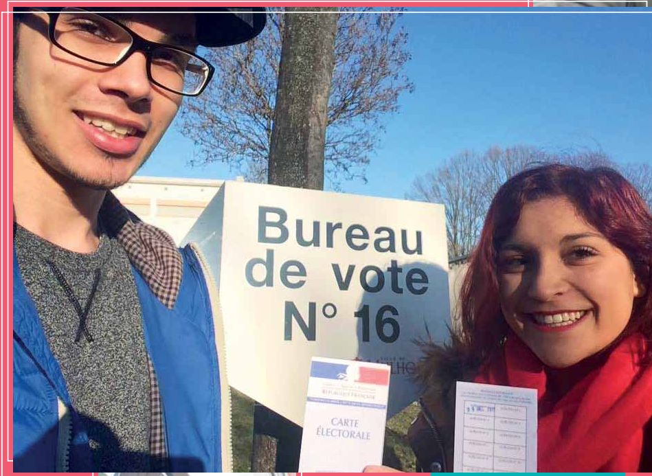
Le Comité Jeunes passe à l'action pour l'opération #SelfieJeVote