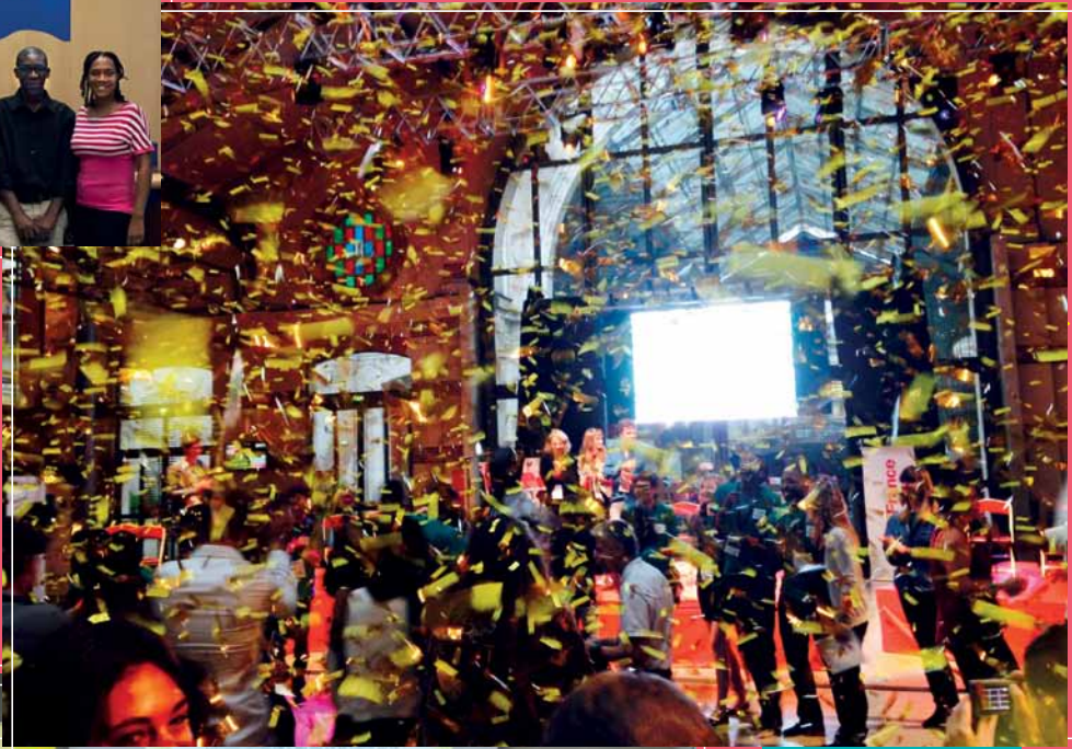
Clôture du CRJD'1Jour 2015