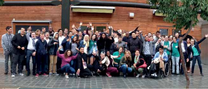
Le CRJ d'1 jour, du 11 au 13 septembre 2015 à Paris

le 10 e anniversaire du Conseil régional des jeunes de la région. Autour des jeunes conseillers franciliens, les représentants d'autres régions telles que la Guadeloupe, les Pays de la Loire ou encore de Rhône-Alpes, ont participé aux festivités. À leurs côtés, nous avons aussi pu retrouver les conseillers