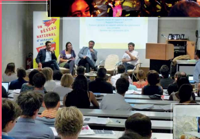
Les membres du bureau de l'Anacej lors de l'Assemblée générale, en juin 2015, à Figeac